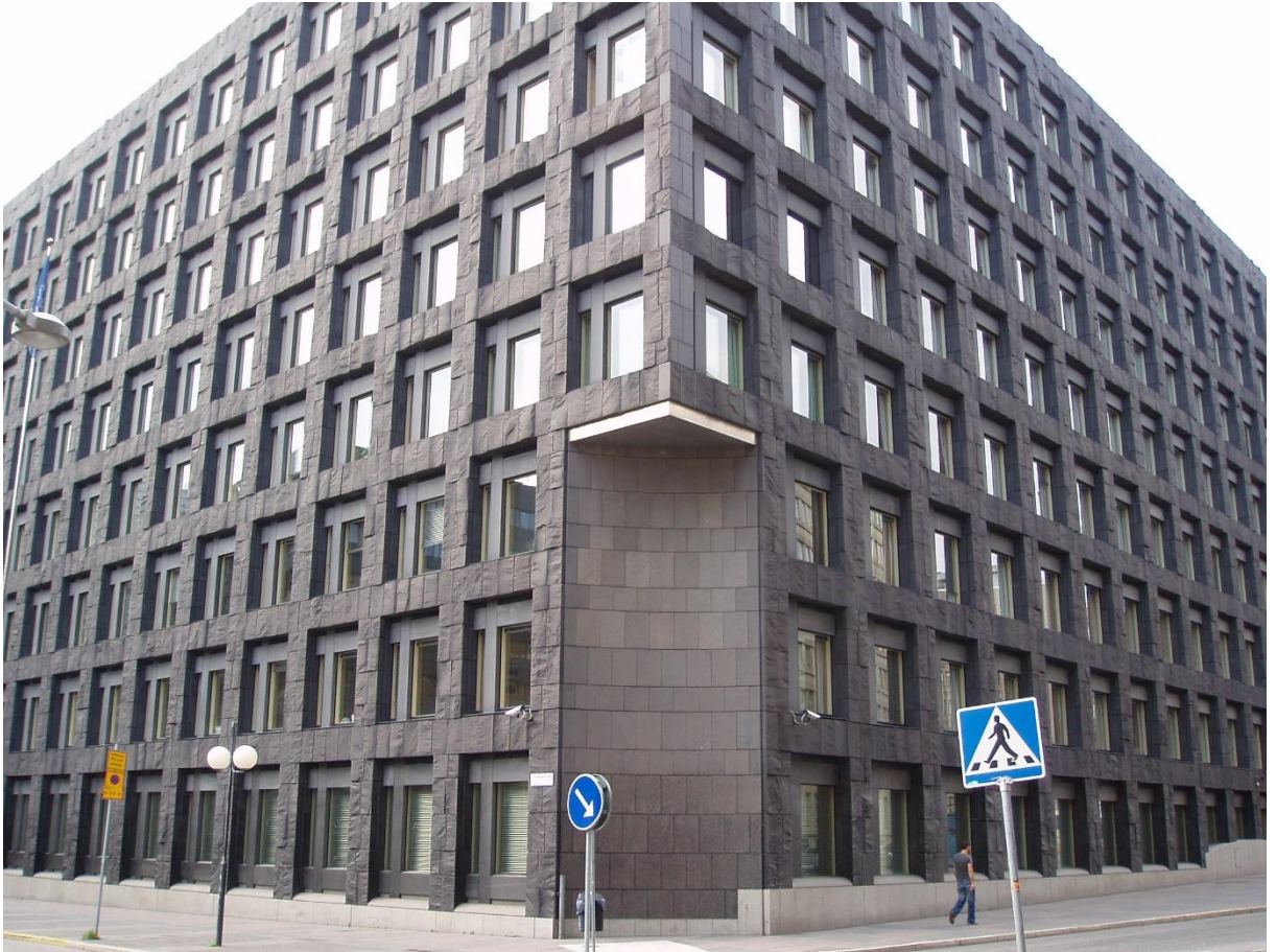
Bild: Riksbankshuset, Sveriges riksbanks huvudbyggnad, belägen vid Brunkebergstorg i Stockholm

Riksbanken 351 år för att vara exakt! Vi tar en tur genom Riksbankens historia, från bankkrasch till minusränta. Sveriges riksbanks dramatiska historia är ju också Sveriges ekonomiska historia!