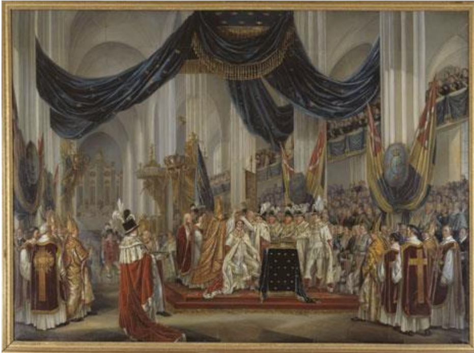
Bild: Kröningen av Karl XIV Johan 1818

Mon dieu, vilken saga! Vi vandrar i spåren av Sveriges komplicerade förhållande till Frankrike genom historien; som allierad, som förebild, som skräckexempel och på det personliga planet. Hör till exempel om Drottning Kristinas möte med Descartes, om tidernas kärlekshistoria mellan Axel von Fersen och Marie Antoinette och om tidernas kulturkrock när Sverige fick en fransk kung!