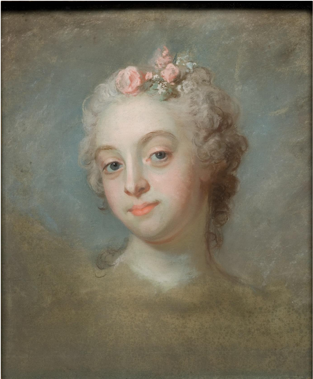
Bild: Porträtt av Hedvig Taube av Gustaf Lundberg, Nationalmuseum