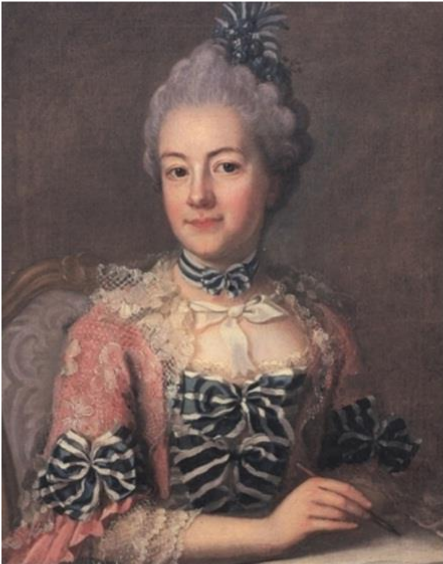
Bild: Porträtt av Hedvig Charlotta Nordenflycht (1718-1763)

1700-talets kulturbråk var inte mildare än dagens, kanske snarare tvärtom. Möt huvudstadens kändisar, hör på roliga anekdoter ur deras liv och få några smakprov på deras skaldeförmåga. Följ med och se var de bodde och verkade. Hur såg de på varandra? Vilka var vänner och vilka var fiender? Vi möter Anna-Maria Lenngren, Johan Henrik Kellgren, Carl Michael Bellman, Tomas Thorild, Tobias Sergel, Olof von Dalin och Hedvig Charlotta Nordenflycht.